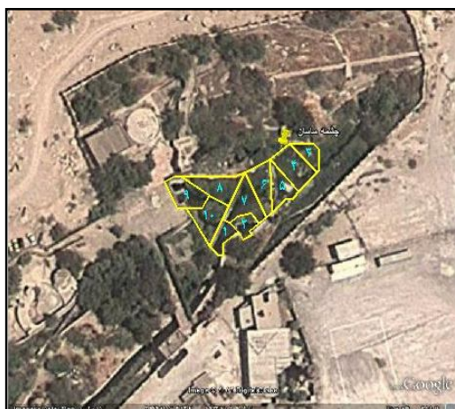
شکل ۱: منطقه بندی چشمه ساسان

آب لوله کشیکلر زده شده نیز جهت تعیین بو و وجود جلبک نیز نمونه برداری شد. حجم نمونه مورد نظر برای آب تصفیه شده ۳ لیتر و برای آب خام ۱ لیتر بود، که مطابق با روش نمونه برداری در کتاب روش های استاندارد در آزمایش های آب و فاضلاب انجام شد (استاندارد متد (۱۳)).