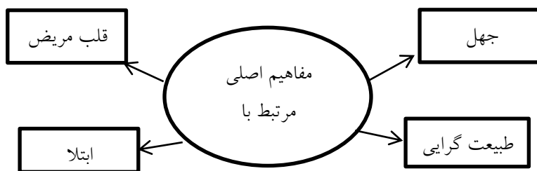
شکل ۲: مفاهیم اصلی مرتبط با ناهنجاری (۴ مضمون اصلی)