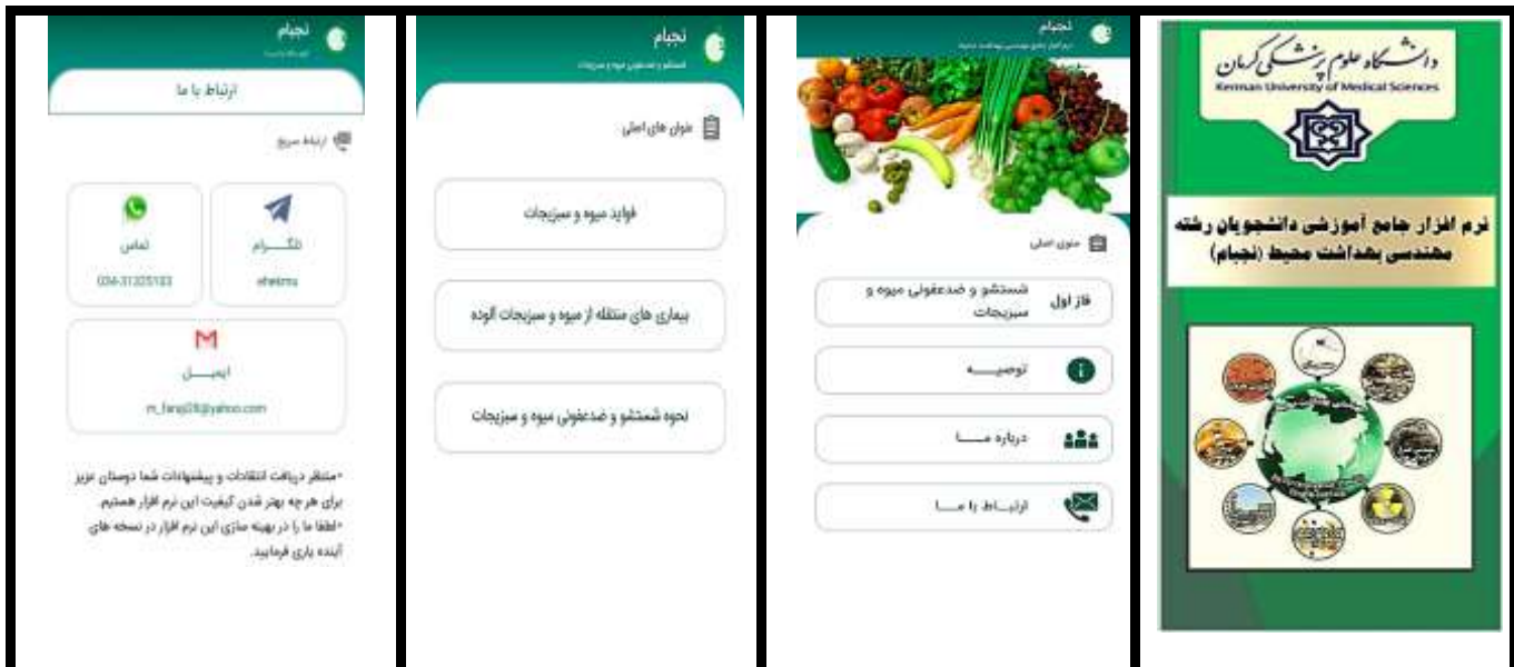
عکس ۱: تصاویری از صفحات نرم افزار طراحی شده در مطالعه

همچنین در قسمت توصیه (عکس ۱-ب)، توصیه های لازم در خصوص استفاده از اطلاعات برنامه ارائه شده است. دسترسی کاربران به اطلاعاتی در زمینه معرفی و هدف نرم افزار، فازهای آتی آن، معرفی تیم طراحی و ساخت و منابع مورد استفاده برای تهیه مطالب آموزشی موجود در نرم افزار از طریق منوی درباره ما فراهم شده است.