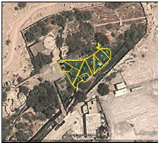
شکل ۱: منطقه بندی چشمه ساسان

آب لوله کشیکر زده شده نیز جهت تعیین بو و وجود جلبک نیز نمونه برداری شد. حجم نمونه مورد نظر برای آب تصفیه شده ۳ لیتر و برای آب خام ۱ لیتر بود، که مطابق با روش نمونه برداری در کتاب روش های استاندارد در آزمایش های آب و فاضلاب انجام شد) استاندارد متد (۱۳).