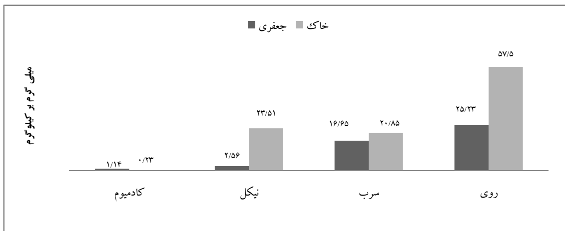
نمودار ۱: غلظت فلزات (متوسط: ۹ نمونه) در جعفری و خاک مزارع

۶- شاخص خطر و سلامت: ارزیابی خطر سلامت برای مصرف کنندگان بر اساس مصرف محصولات آلوده با فلز با استفاده از شاخص خطر و سلامت (HRI) مشخص شد. اگر ( HRI > 1 ) بود