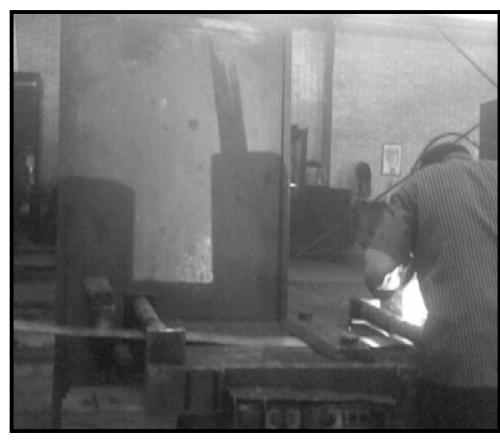
شکل ۱: طراحی سپر برای جلوگیری از پاشش جرقه و پلیسه ناشی از دستگاه سنگ زنی