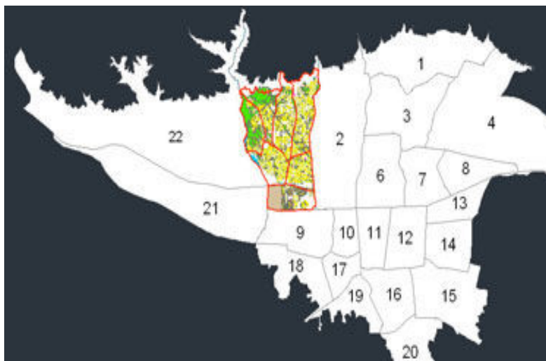
شکل ۱: موقعیت مکانی منطقه مورد مطالعه

شود (۴). مصارف متنوع از فرآورده های کاغذی در امور نوشت افزار، بسته بندی، بهداشتی، تزئینات و دکوراسیون، به نحوی روزافزون نیاز به محصولات سلولزی را به عنوان ضرورتی اجتناب ناپذیر در آورده است (۹). بعد از مواد زاید جامد فسادپذیر و قابل کمپوست، کاغذ دومین جزء با ارزش و قابل بازیافت زباله در شهرها می باشد (۱۰). مطالعات نشان می دهد که هر تن کاغذ بازیافتی از قطع ۱۷ اصله درخت جنگلی جلوگیری می نماید (۱،۶). در ضمن بازیافت یک تن کاغذ به صرفه جویی در ۶۹۵۳ گالن آب، ۴۶۳ گالن نفت، ۵۸۷ واحد کاهش آلودگی هوا و ۴۰۷۷ کیلووات انرژی منجر می شود (۱). در ایران مصرف سرانه کاغذ بیش تر از ۱۱ کیلوگرم در سال است که این مقادیر از طریق چوب، کاه و کاغذهای باطله یا خمیرهای وارداتی تامین می گردد (۴). تولید یک تن خمیر کاغذ حدود ۴۰ کیلوگرم ضایعات آلاینده را وارد محیط می کند (۳،۹). منطقه پنج شهرداری تهران با جمعیت ۸۳۰۰۰۰