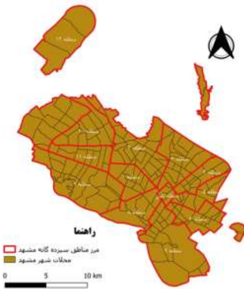
شکل ۱: نقشه مناطق ۱۳ گانه شهر مشهد و تقسیم‌بندی محلات شهر

انتقال خون، بهزیستی، مراکز انتظامی، گرم خانه‌ها، دفاتر پیشخوان و جایگاه‌های سامان‌دهی کارگران می‌باشد. پس از آماده‌سازی لایه‌های اطلاعاتی در محیط نرم‌افزار ArcMap 10.4.1 تعداد هر کدام از لایه‌ها و مراکز ذکر شده در هر محله شهر مشهد محاسبه و تمامی اطلاعات مورد نیاز در یک فایل اکسل جمع‌آوری گردید. این مطالعه در زمستان ۱۳۹۹ انجام شده است.