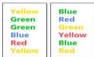
شکل ۱: آزمون استروپ

این کلمات به صورت تصادفی و متوالی نمایش داده می شود که هدف از این مرحله انعطاف پذیری ذهنی، تداخل و بازداری می باشد (۲۰). اعتبار این آزمون بر اساس مطالعات انجام شده ۰/۸۳ گزارش شده است (۲۱). (شکل ۱)