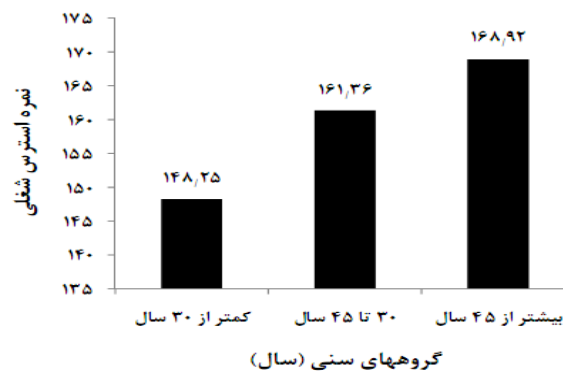
نمودار ۲: توزیع استرس شغلی در گروه‌های سنی مختلف (P=۰/۵۸)